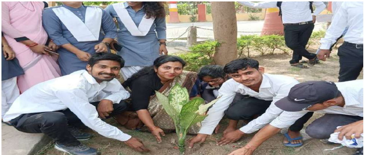
वृक्षारोपण कार्यक्रम 2022-23