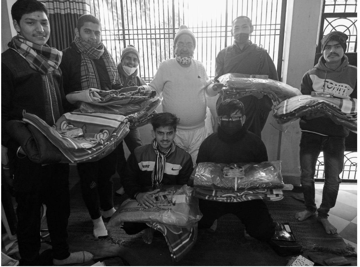
संस्कृत छात्रों को सहायता 05.09.2021