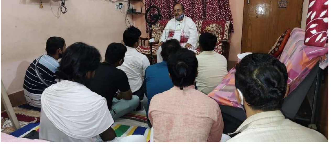
काव्य लेखन प्रशिक्षण 20.05.2022