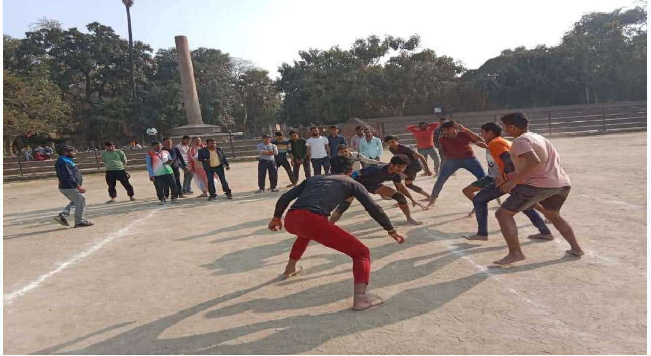
युवा-महोत्सव- २०.०५.२०२३ क्रीडाङ्गण सं.सं.वि.वि