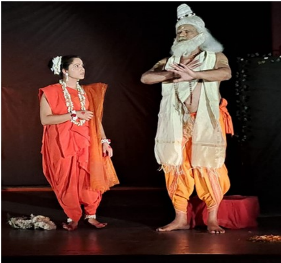
( संवाद द्वारा शिक्षण )

Registrar Sampurnanand Sanskrit University Varanasi