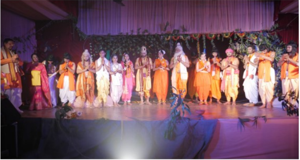
( काव्य ग्रन्थों का क्रियात्मक शिक्षण )